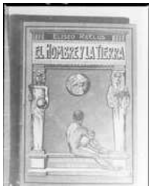
Publicado por la Escuela Moderna.

una clara apuesta por la ciencia, y pidiendo la colaboración de los más eminentes científicos internacionales y españoles para tal proyecto.