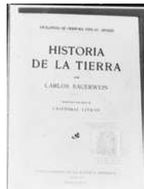
Fotografía de la portada del libro de Carlos Sauerwein, "Historia de la Tierra".

Es de justicia reconocer la gallardía de llevar a cabo su apuesta educativa, así como su convicción ideológica y utópica, que como es lógico, y ha quedado explicado en los párrafos anteriores, entra dentro de lo que una persona con su temperamento, su capacidad, su ambición intelectual y su compromiso social, hubiera realizado en el contexto histórico que a él le tocó vivir.